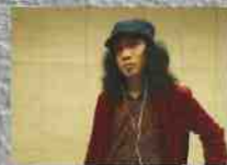
エレクトロニカ・ユニット