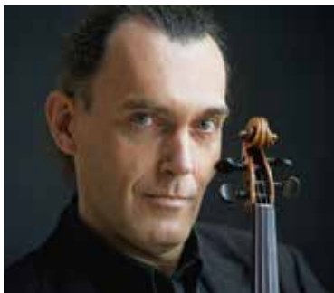
ヴァイオリン オリヴィエ・シャルリエ