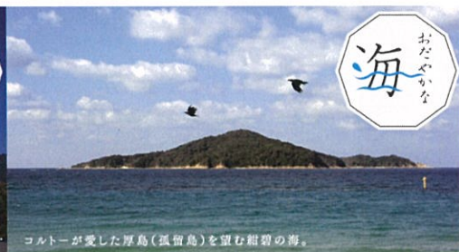
コルトーが愛した厚島(孤留島)を望む紺碧の海。