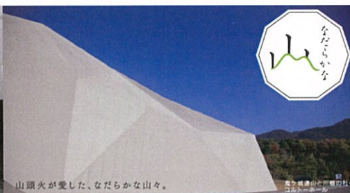
山頭火が愛した、なだらかな山々。