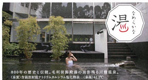
800年の歴史と伝統。毛利侯御殿湯の面影残る川棚温泉。 (泉質)含硫酸射水ナトリウムカルシウム塩化物泉 41.1℃

毛利侯・山頭火・アルフレッドコルトー。偉人たちの愛したまち、川棚温泉。 まろやかな山・海・湯が奏でる田園交響曲。