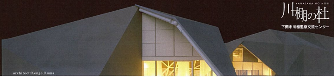
architect: Kengo Kuma