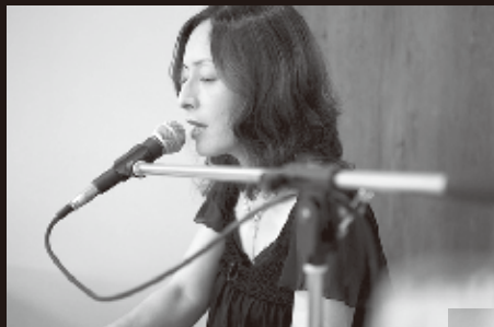
1st アルバム 「Sweet Season」 2013.6.24 発売