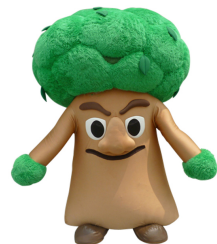
森の番人「クスジー」